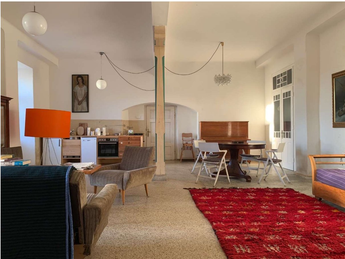
Gesamteindruck der Ferienwohnung mit viel Patina und manchen Fehlstellen.

„Die Zusammenarbeit mit der Werkstatt Mosler und dem Leinölladen hat auch meine Maßstäbe in der Beurteilung von Ästhetik verändert.“