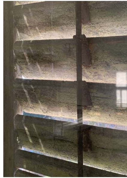
Fensterladen Badezimmer – fertig!