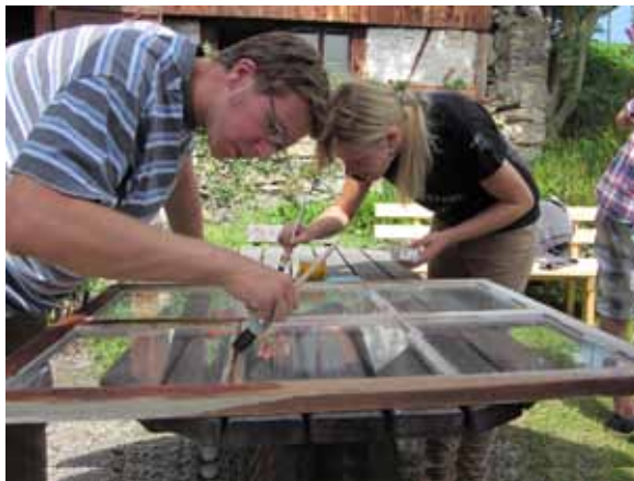
Erster Pflegeanstrich nach Jahrzehnten für das Außenfenster aus Lärchenholz, das aus den 1930er Jahren stammt.

Für die fünf Kinder der Familie war das Bauernhaus immer ein Ort des Abenteuers und der Unbeschwertheit, in dem sie ihre Ferien verbrachten. Inzwischen sind sie erwachsen und haben ihre Liebe und Verantwortung für ihr Kultur- und Familienerbe entdeckt. Einen Beitrag dazu leistete auch ein gemeinsames Projekt, mit dem die Eltern die Bindung an das Haus und dessen Wertschätzung bei den Kindern stärken wollten: Im Sommer 2012 trafen sie sich alle vor Ort, um die Außenfenster zu pfle-