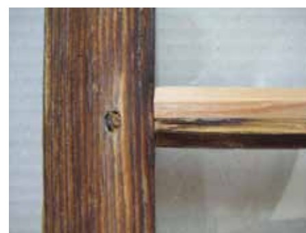
Exakte und materialgerechte Ergänzung einer außenseitig abgewitterten Sprosse mit Glasnut.