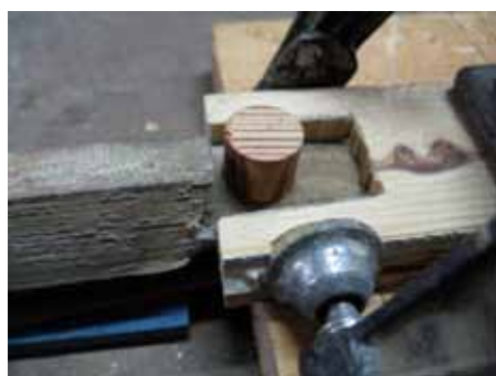
So lassen sich ausgerissene Zapfenlöcher einfach reparieren: Mit dem Forstnerbohrer das Loch vergrößern und einen Querholzdübel einpassen. Lehre und Schraubzwinde stabilisieren die Operation.