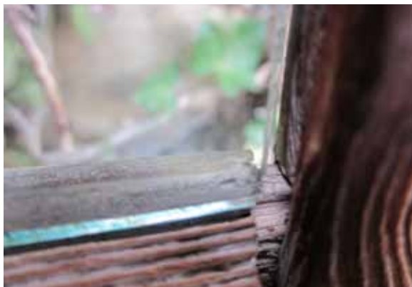
Zugige Fenster durch verzogene aufrechte Flügelhölzer und ausgerissene Zapfenlöcher.

Ich wurde beauftragt, vorab eine Bestandsaufnahme mit Schadenskartierung und Maßnahmenempfehlung zu erstellen. Bei den vorhandenen Fenstern handelte es sich um einen gut erhaltenen Mischbestand von barocken Innenfenstern aus Tannenholz und geschmiedeten Beschlägen bis zu Vorfenstern von etwa 1930 aus Lärchenholz. Reste alter Leinölfarbanstriche sah man an den Außenfenstern nur unter dem Sturz. Exponierte Holzaußenflächen waren bis zu zwei Millimeter ausgewittert und entsprechend ausgemagert. Von Fäulnis jedoch keine Spur. Die in Glasnut oder Kittfalz gehaltenen Zylindergläser waren nahezu vollständig erhalten. Die Innenfenster in der Stube und den Schlafzimmern waren zuletzt innen mit weißer Baumarktfarbe gestrichen worden.