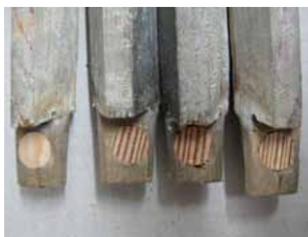
Kleine Reparatur, große Wirkung: Nach Bearbeiten der Querholzdübel bekommen die Holzdübel in den neuen Bohrungen für die nächsten Jahrzehnte wieder einen festen Sitz.