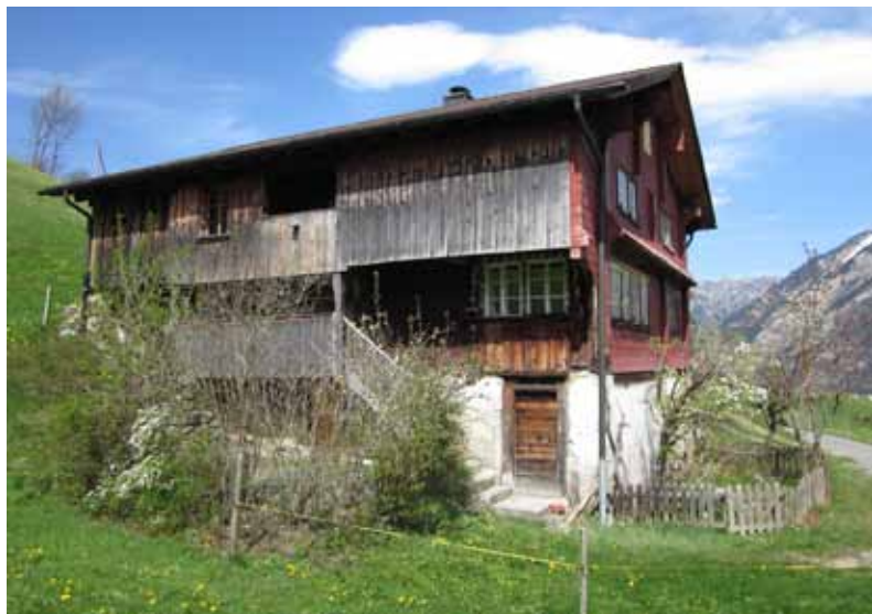
Das urner Bauernhaus Mittlere Bärchi