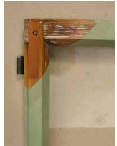
Hilfestellung für den Zimmermann durch den Fensterrestaurator: Am Fensterprofil wurde Holz materialgerecht ergänzt. Die Anstrichabfolge mit Leinölimprägnierung und Leinölfarbe macht den Anstrichaufbau transparent und ablesbar.

Auch in Jahrhunderte alten Denkmälern lassen sich die alten Holzböden erhalten, ohne Gebrauchsspuren und ihre Patina für immer wegzuschleifen. So wurden auch die Böden in der Stüssihofstatt behandelt.