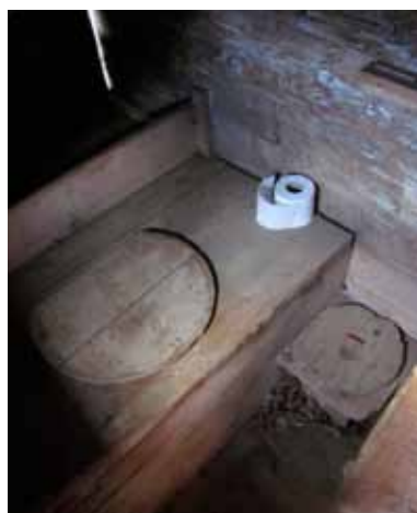
Auf dem stillen Örtchen hat man auch an kleine Bewohner gedacht. Die Komposttoilette ist in dem Bauernhaus Mittlere Bärchi nach wie vor in Betrieb. Auf ein Wasserklosett wurde zugunsten der Ursprünglichkeit verzichtet.

In der hinteren Haushälfte liegen die Küche und eine angeschlossene Speisekammer. Auf gleicher Höhe sind außen am Haus ein Holzlager und neben dem Stübli ein Abort eingerichtet. Auf die Küche folgen ein Keller und die frühere kleine Sennerei, die heute als Waschküche genutzt wird. Im Obergeschoss gibt es zwei große und eine kleine Kammer sowie einen Vorraum. Direkt unter dem relativ flach geneigten Dach liegt eine weitere Kammer. Die von den Vorbesitzern eingebaute Zentralheizung wurde durch einen gemauerten grünen Kachelofen zwischen Stube und Stübli ersetzt. Fließendes Wasser gibt es nur in der Waschküche. Die Plumpsklos von damals sind nach wie vor in Funktion.