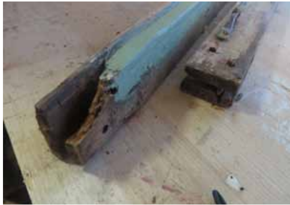
An diesen Fensterprofilen hat der Zahn der Zeit genagt. Und doch konnten sie dank exakter Musterreparatur und detaillierter Arbeitsdokumentation problemlos von einem Zimmermann instand gesetzt werden.

zen, Ergänzungen mit Holz gleichen Alters auszuführen, Blindzapfen einzusetzen. Auch die Oberflächenbehandlung orientierte sich an den Bedürfnissen historischer Fenster: thermische Entfernung filmbildender Lacke, Grundierung mit rohem, kaltgepressten Leinöl, zwei Anstriche Leinölfarbe ohne Lösemittel, Schlussanstrich mit fünf Prozent Leinölstandöl. Die Beschläge wurden zerstörungsfrei demontiert, schwarzgebrannt und wieder angebracht.